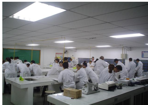
Laboratório de Química