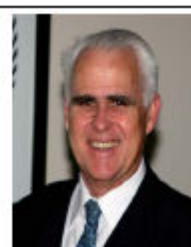
Charles Holland Contador, profissão em extinção?