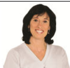
Deputada Estadual Célia Leão Ética e Cidadania.